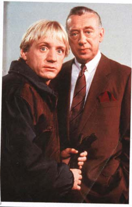
PIERRE FRANCKH mit Horst Tappert in der Folge „Tödlicher Ausweg“ der erfolgreichen ZDF-Krimiserie „Derrick“ (1984)