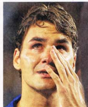
Tennis-Held Roger Federer nach einer Finalniederlage 2009 gegen Rafael Nadal.