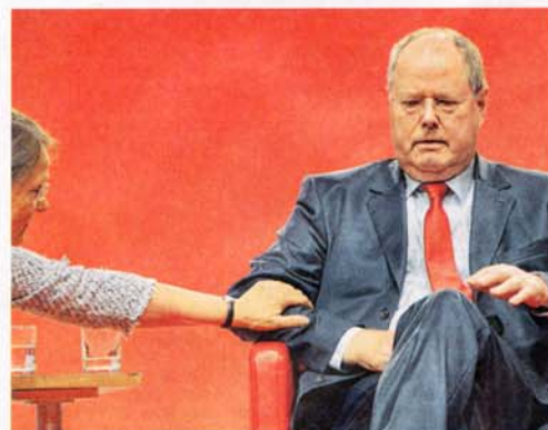
Peer Steinbrücks gefühvoller Aussetzer im Sommer des Wahlkampfs.