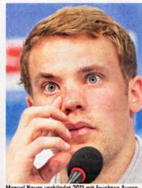
Manuel Neuer verkündet 2011 mit feuchten Augen seinen Wechsel von Schalke nach München.