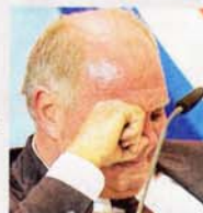
Einfach laufen lassen: Uli Hoeneß und seine Tränen.

aufkommen, die Menschen singen: „Es gibt nur ein Uli Hoeneß.“ „Dass es so überwältigend, einstimmig und glasklar ist, habe ich nicht gedacht“, sagte der 61-Jährige nach Ende der Versammlung zu den Reportern. Er ist kurz angebunden, Autogramme und Fotos für seine Anhänger sind wichtiger, er sagt noch: „Es ist bei mir