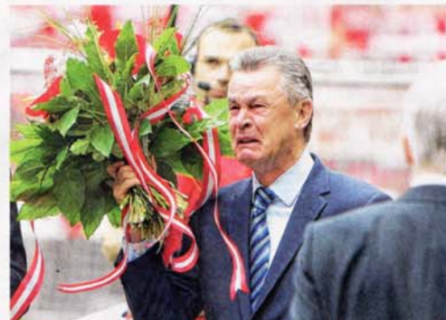
Zum Abschied Blumen und Tränen: FC-Bayern-Coach Ottmar Hitzfeld 2008